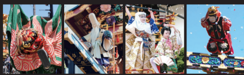
神楽台組(獅子舞) 青龍台組(からくり) 白虎台組(子供歌舞伎) 麒麟台組(からくり)